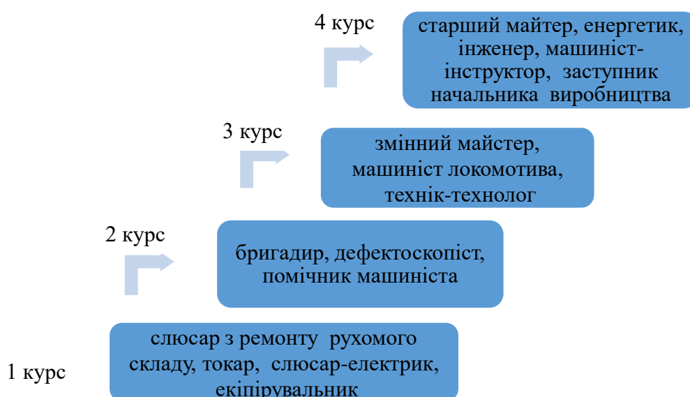
Рис. 1. Схема професійного зростання на посадах підприємств локомотивного господарства впродовж навчання за дуальною формою під час підготовки спеціалістів-залізничників

Так, для першого року навчання це можуть бути посади: слюсар з ремонту рухомого складу, токар, слюсар-електрик, екіпірувальник; для другого – бригадир, дефектоскопіст, помічник машиніста; для третього – змінний майстер, машиніст локомотива, технік-технолог; для четвертого – старший майстер, енергетик, інженер, машиніст-інструктор, заступник начальника виробництва.