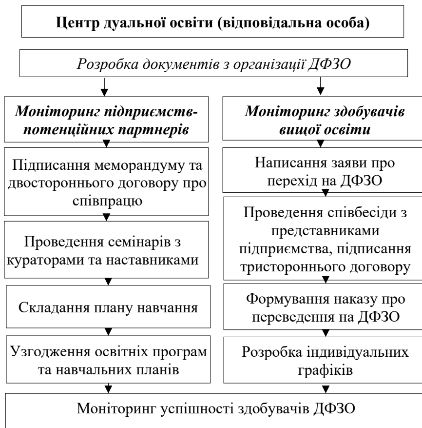
Рис. 1. Алгоритм реалізації ДФЗО у Поліському національному університеті

Реалізація ДФЗО потребує відповідного порядку дій як з боку закладів вищої освіти так, і з боку роботодавців. Перший досвід пілотних проєктів надав можливість розробити алгоритм нагальний дій, який з досвідом може бути вдосконалений та доповнений (рис. 1).