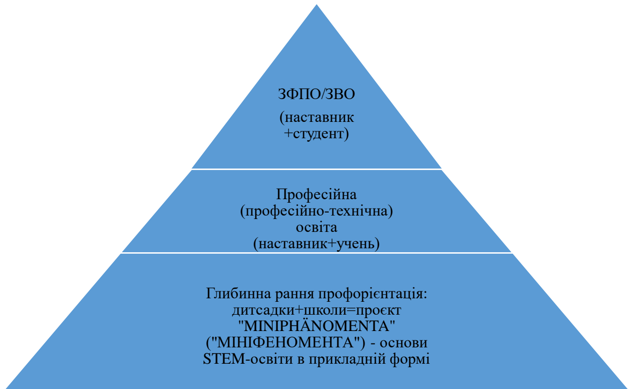
Рис. 1. Перспективна модель дуальної освіти*

З урахуванням вказаних чинників, вважаємо перспективною таку модель ДФЗО (рис. 1).