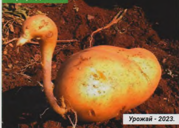
Урожай - 2023.