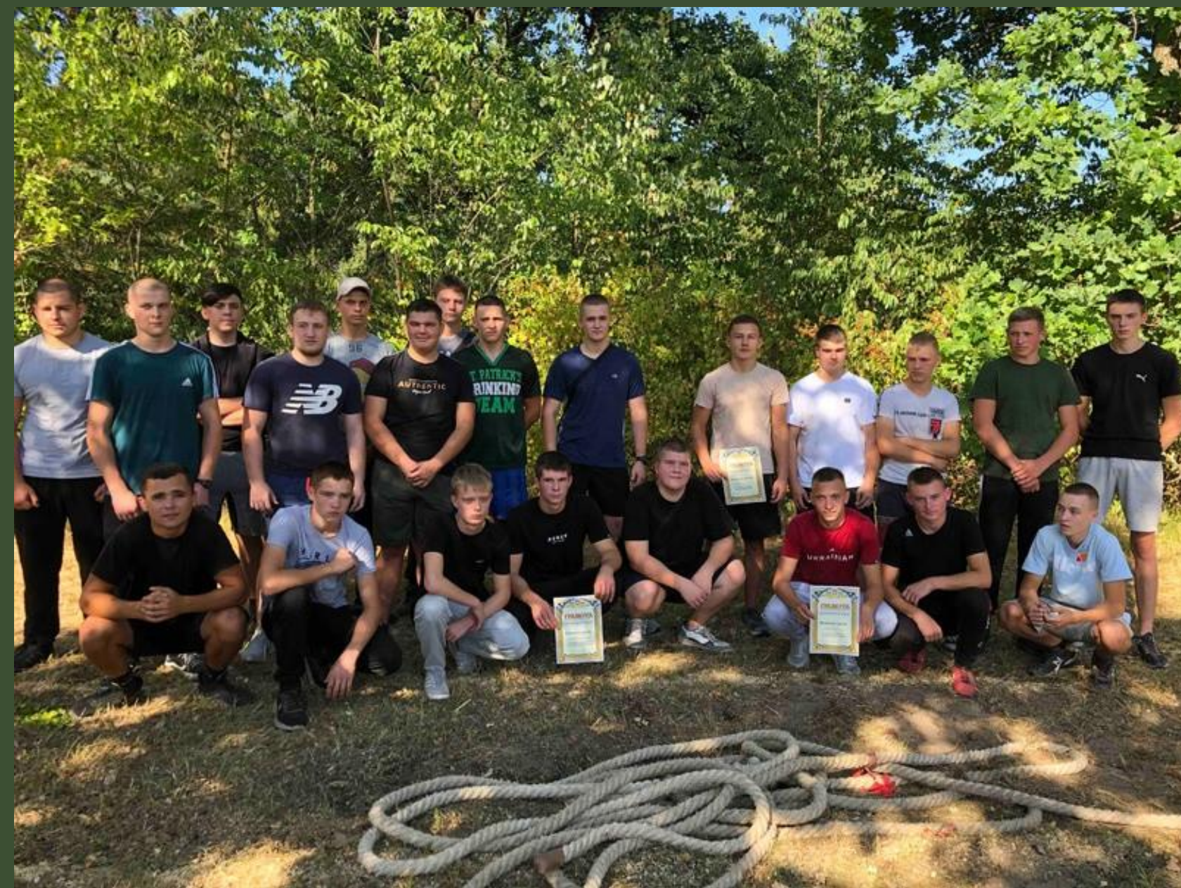
Олімпійський тиждень спорту